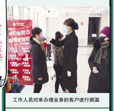
工作人员对来办理业务的客户进行测温